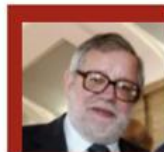
Prof. Avv. Giovanni Maria Flick

Presidente Emerito della Corte Costituzionale